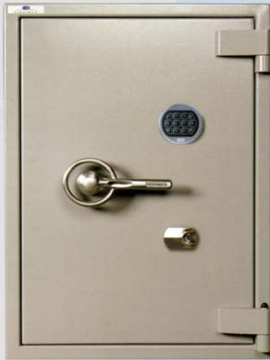
Arma Corta - Nivel III