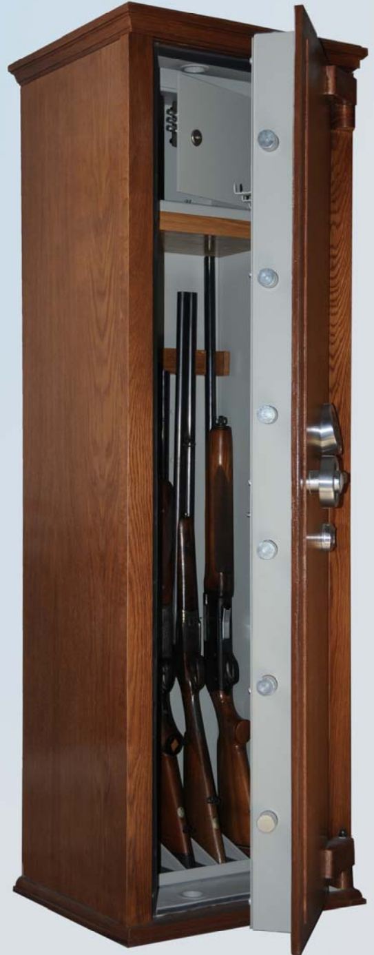
Arma larga - Nivel I

Todos los modelos de cajas fuertes están ensayados en los laboratorios más prestigiosos, acreditando los niveles de seguridad con la certificación oficial correspondiente. Nuestra producción esta certificada por Applus garantizando con ello que el producto suministrado tiene unas características constructivas idénticas a las ensayadas