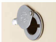
MIRILLA CLÁSICA Cromada o latón