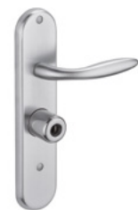
MANILLA Acabado cromado o latón pulido