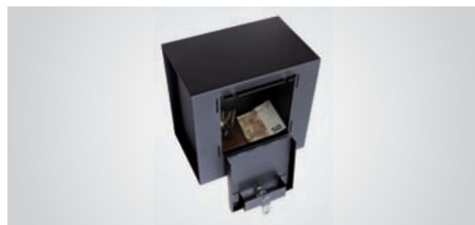
Dispone de capacidad para guardar pequeños objetos de valor.