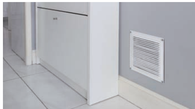
Puede ser ocultado en cualquier rincón de la vivienda o inmueble.